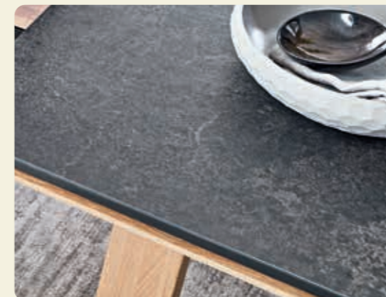
HPL-Platte mit Reliefoberfläche, erhältlich in den Designs Zement, Beton und Granit