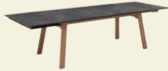
Zargenauszug mit Falteinlage je 50 cm, Scandi-Gestell Massivholz 180(280)/200(300)/220(320) x 100 cm