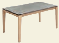
Feste Platte, ohne Funktion, Classic-Gestell Massivholz mit Dickschicht Edelfurnier 140/160/180 x 90 cm 160/180/200 x 100 cm