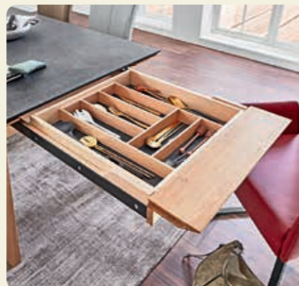
An der anderen Seite lässt sich der Zargenauszug mit einer praktischen Besteckschublade bestücken.