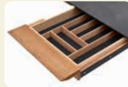
Zargenauszug mit Bestecklade