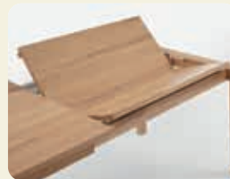
Gestellauszug mit 2 Klappeinlagen à 45 cm