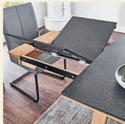
Die skandinavisch anmutenden Tische lassen sich einseitig durch einen Zargenauszug mit Falteinlage verlängern.

Ausführung: Gestell Wildeiche, HPL Granit-Design