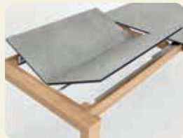
Gestellauszug mit 1 Klappeinlage à 100 cm