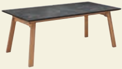
Feste Platte, ohne Funktion Scandi-Gestell Massivholz 180/200/220 x 100 cm