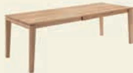
Gestellauszug, 1 Klappeinlage 100 cm, Classic-Gestell Massivholz mit Dickschicht Edelfurnier 140(240)/160(260)/180(280) x 90 cm 160(260)/180(280)/200(300) x 100 cm