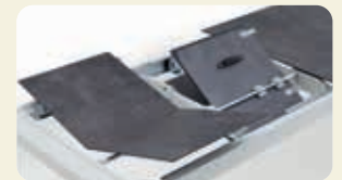
Gestellauszug mit 2 Klappeinlagen à 45 cm