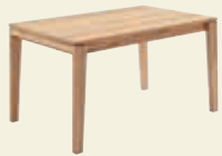
Feste Platte, ohne Funktion, Classic-Gestell Massivholz mit Dickschicht Edelfurnier 140/160/180 x 90 cm 160/180/200 x 100 cm