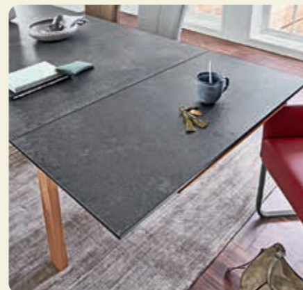
Mit der externen Ansteckplatte können Sie auch diese Seite im Handumdrehen um 50 cm verlängern.