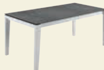
Feste Platte, ohne Funktion Classic-Gestell Massivholz 140/160/180 x 90 cm 160/180/200 x 100 cm